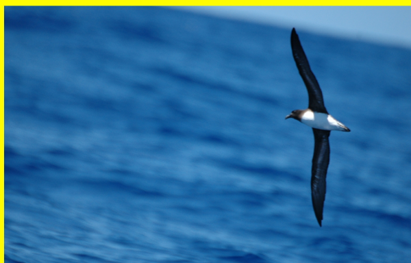
Kacau ni Tahiti