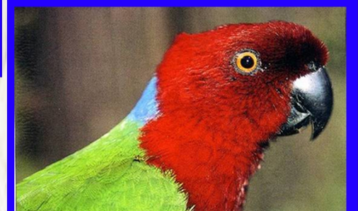
Kaka Ni Vanua Levu