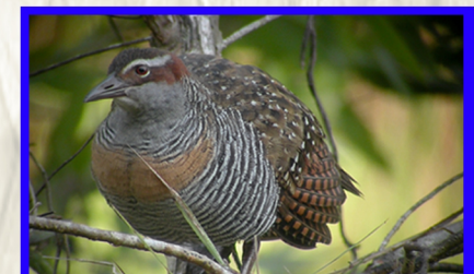
Buff Banded Rail

Vakaraitaki tiko ena mape na Vanua ni Manumanu Vuka (VMV) ena Natewa/ Tunuloa Peninsula (FJ03) kei Taveuni (FJ04), ka vakaraitaki tale tiko ga na veimataqali manumanu vuka ka rawa ni kune ena 2 na vanua oqo. Na Sisi e rawa ni kune ga ena 2 na vanua oqo ka sega tale ni dua na vanua e Viti..